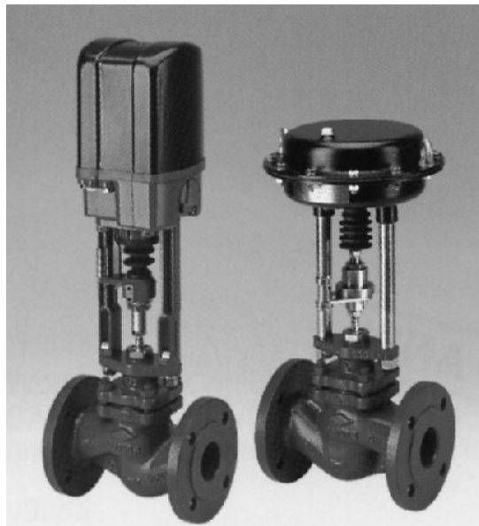
Type 021210 + 021310 (Beispielabbildung) Type 021210 + 021310 (example)